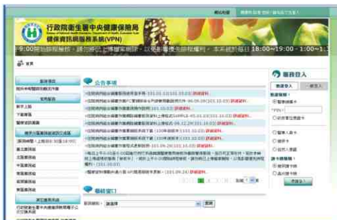
圖-1 健保資訊網服務系統 (VPN) 首頁