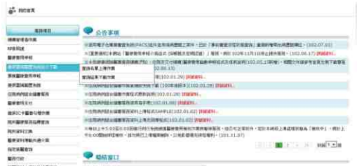
圖-3 健保資訊網服務系統 (VPN) 我的首頁