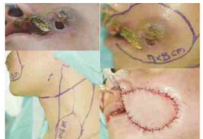
▲ 末期口腔癌病人手術重建，改善生活品質。

顱顏面咬合重建中心，提供急重症外傷、顏面骨折及顏面軟組織外傷處理，擁有完整內外科知識與技術，提供病人治療，後續重建手術、假牙贖復整形手術、顎面及齒顎手術矯正，讓病人就近醫療，人工植體重建中心更提供缺牙無牙病人正常咬合咀嚼功能。