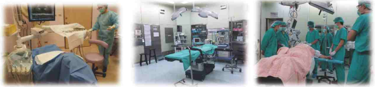
▲ 專業無菌感染控制手術流程與專業手術開刀房治療。

佳的治療水準，讓微創手術、微創植牙與微創牙科診治不再是難事，並且提供德國LEICA顯維鏡提供微創根管手術、牙齒美白噴沙機、符合行政院衛福部公告牙醫醫療機構設置標準，各項訓練課程應有的儀器設備與器械，一應俱全，高規格殺菌消毒器材，解決看不見的微生物感染控制，提供隔離無菌、乾淨且安靜的手術環境。