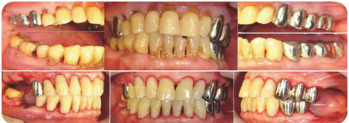
▲ 身心障礙特殊需求牙科特殊需求者牙科治療 - 高齡失能老年人口腔照護。