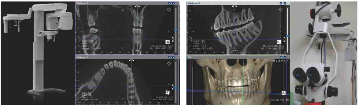
▲ 數位斷層掃描，精確診斷病人口腔狀況提供治療。

教學方面定期繼續教育與病歷討論會議室，醫師們開會討論治療計劃。醫院亦提供完整的牙科專業圖書與電子期刊，因應訓練教學需要，另提供合適之教學設備，設備包括：X光設備、根尖X光機、齒顎全景放射線檢查、根管測量儀、雙側咬合X光儀、樹脂光固化機、電刀、寬頻網路、電腦、投影設備，桃園醫院圖書館提供所有參考書籍、期刊和論文、衛生福利部Cohort資料庫。