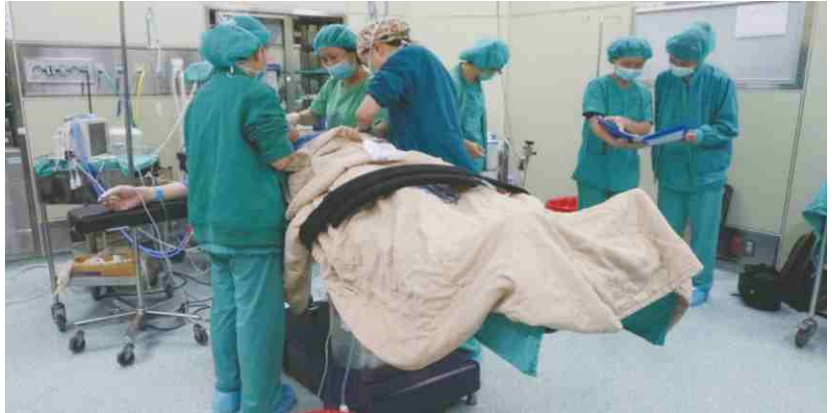
▲ 專業的病人保護裝置及專業的麻醉醫師團隊，標準的手術流程。

桃園醫院成立「特殊需求者牙科醫療服務中心」，擴大包含孕婦、HIV、唇顎裂、發展遲緩兒、特殊需求者和身心障礙門診服務。提供一個特殊需求者口腔照護獨立空間，落實身心障礙者口腔照護，以促進病人口腔健康，提高就醫之可近性，更提供舒眠麻醉治療、全身麻醉治療以及自閉發展遲緩病人全能牙科治療，達到預防勝於治療效果。提供特殊需求者所需之口腔照護、衛教及治療後追蹤，並進行與一般身心障礙者牙科醫療服務醫院與聯合評估中心或發展遲緩療育機構合作，建立聯合醫療網絡。