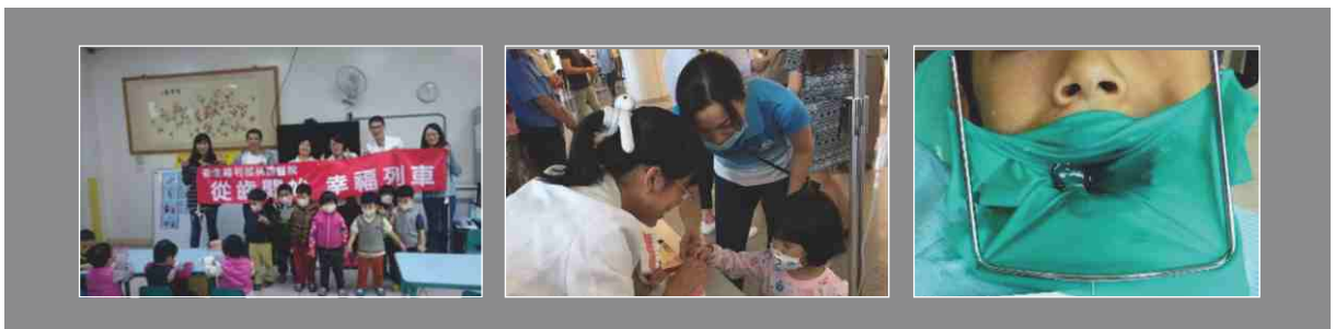
▲ 社區牙科口腔衛生教育，兒童牙科治療及預防醫學教育。

社區服務部分有鑑於身障病患的需求，身心障礙者具有許多特性，以致其比一般人更難接受到牙科治療，同時牙科醫師及其他輔助人員也較缺乏治療身心障礙者的經驗與設備。因此，在就醫困難及醫療人力缺乏的雙重匱乏下造成身心障礙者口腔狀況的惡化。醫院經費投入數佰萬元，增建特殊需求手術室及相關設備和人員受訓，特殊需求牙科內設有3台牙科治療椅，一般治療區有可以提供舒眠麻醉的診療椅和相關的設備，另外在開刀房內設有牙科專用的時段，提供診療枱施行全身麻醉治療。一般治療區各治療椅處均設有氧氣供應，除一般牙科治療外，可進行靜脈鎮靜麻醉、舒眠麻醉及權充麻醉後之恢復區。全麻區擁有麻醉機、生理監視器、電極器及電子喉頭鏡等，可進行如開刀房之全身麻醉。亦有移動式X光機，可在麻醉下進行X光攝影，增加診斷與治療的便利性。