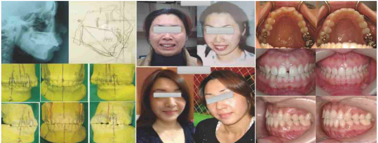
▲ 對於顱顏面發育異常，咬合不正，接受正顎手術治療，重拾美麗笑容 專業隱形矯正，恢復完美咬合。

社區服務部分有鑑於身障病患的需求，身心障礙者具有許多特性，以致其比一般人更難接受到牙科治療，同時牙科醫師及其他輔助人員也較缺乏治療身心障礙者的經驗與設備。因此，在就醫困難及醫療人力缺乏的雙重匱乏下造成身心障礙者口腔狀況的惡化。醫院經費投入數佰萬元，增建特殊需求手術室及相關設備和人員受訓，特殊需求牙科內設有3台牙科治療椅，一般治療區有可以提供舒眠麻醉的診療椅和相關的設備，另外在開刀房內設有牙科專用的時段，提供診療枱施行全身麻醉治療。一般治療區各治療椅處均設有氧氣供應，除一般牙科治療外，可進行靜脈鎮靜麻醉、舒眠麻醉及權充麻醉後之恢復區。全麻區擁有麻醉機、生理監視器、電極器及電子喉頭鏡等，可進行如開刀房之全身麻醉。亦有移動式X光機，可在麻醉下進行X光攝影，增加診斷與治療的便利性。