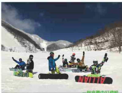
一起來雪中打滾吧