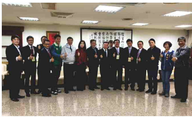
日期：108年2月20日 拜會邱奕勝議長