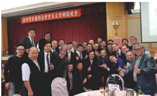
日期：108年2月24日 新竹市牙醫師公會大會