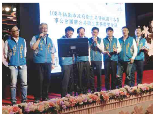
日期：108年2月21日 醫事團體聯誼餐會