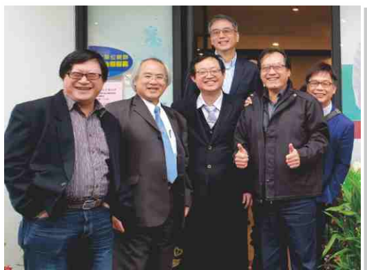
日期：108年2月23日 理事長聯誼會