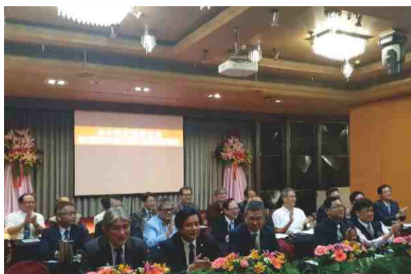
日期：108年4月21日 參加台中市會員大會