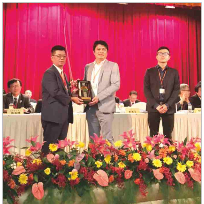
109.7.26 黃理事長出席全聯會14-1大會 ▶