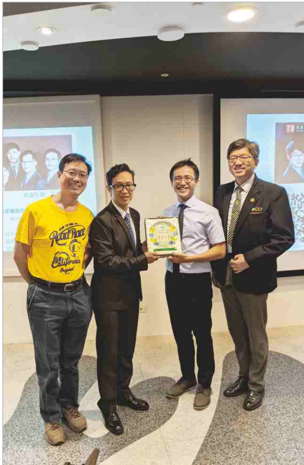
日期：109-8-9 講師：孫少輔律師 主題：安心執業必需了解的法律議題