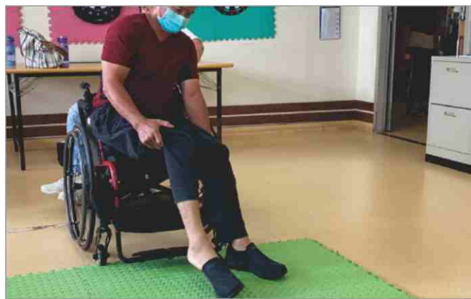
圖1&2：跌倒爬起，看似對一般人稀鬆平常，卻是每位學員來中心的首要訓練課題。