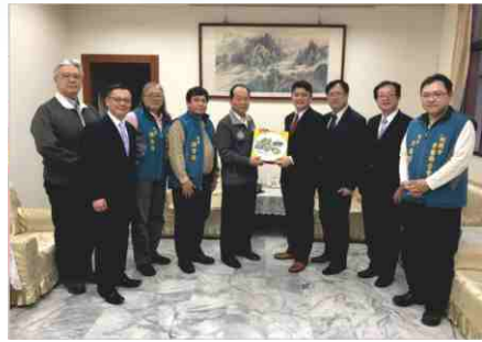
108.11.4 拜會桃園市政府警察局陳國進局長