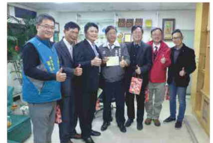
109.1.20 拜會桃園市政府衛生局王文彥局長