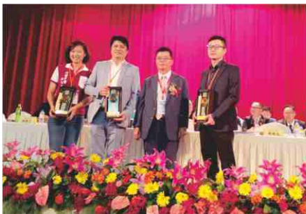
109.7.26 全聯會第14-1次會員代表大會