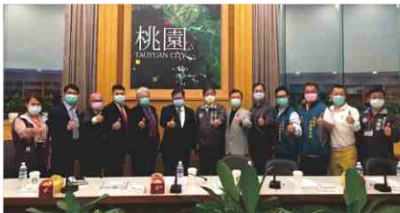
109.4.23 鄭市長與防疫第一線醫護人員合影