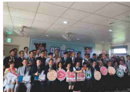
109.8.20 幸福基金會友愛家園揭幕