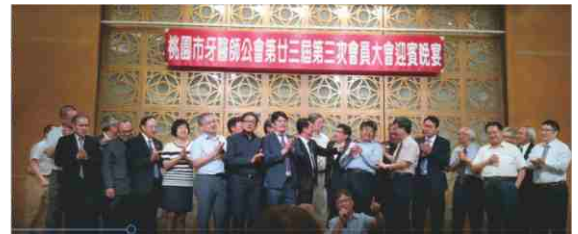
109.7.5 第23-3次會員代表大會