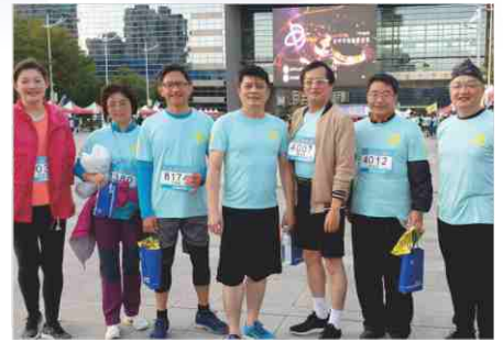
108.12.8 全國牙醫師盃路跑活動