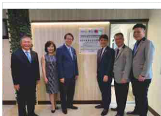
109.5.29 友愛牙科室、扶輪社的揭牌儀式