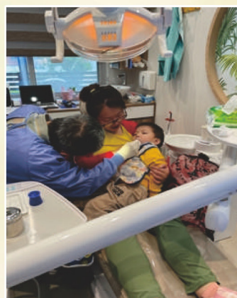
有效解決幼兒治療哭鬧的問題