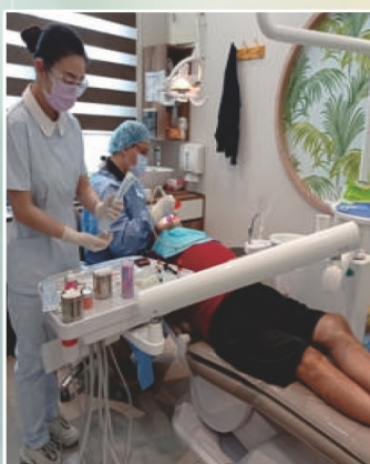
助理隨側協助醫師準備器械