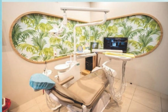
▲善用社會資源結合國際扶輪3502地區捐贈牙醫醫療設備，建置「觀音牙科醫療站」

由本會14位牙醫師協助固定時段輪班駐點，每週2到週5早上9點到11點半，提供當地居民牙科就診服務。