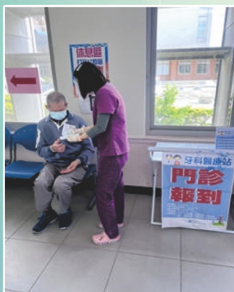
親切清楚說明療後注意事項