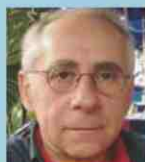
Gregory King 华盛顿大学畸齿矫正系主任、教授 美国华盛顿州西雅图

我们非常幸运的请到了Gregory King教授。Gregory King教授将从繁忙的教学和研究日程中抽出一天的时间为我们授课。授课内容包括: