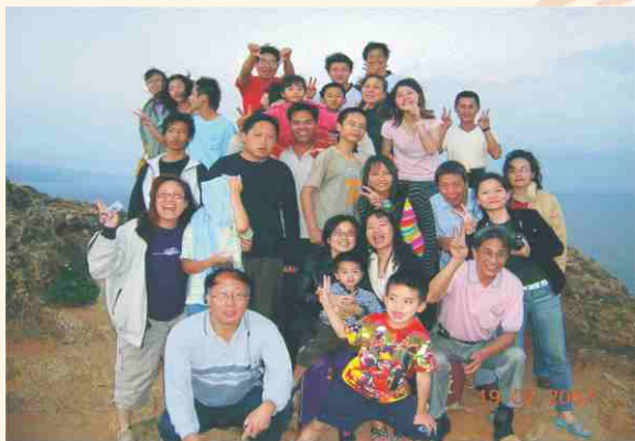
希伯崙全人關懷協會2007年初南下過年