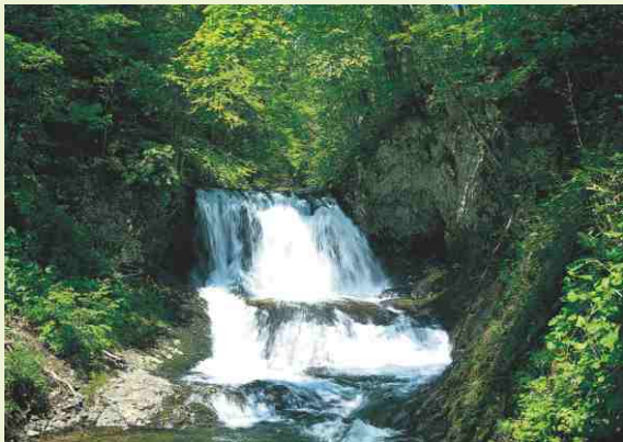
快樂的生活與金錢無關，更主要是生活的觀念。

中文譯為樂活，原文LOHAS，Lifestyles of Health and Sustainability，「健康且永續的生活方式」。事實上，樂活並非享樂，若懷著人類中心的享樂心態，將與樂活精神背道而