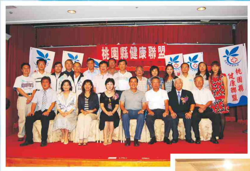
馬英九先生與桃園縣 健康聯盟合照