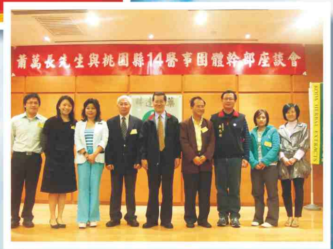
蕭萬長先生與桃園縣14 醫事團體幹部座談會合照