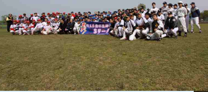
▲6壯士與北縣理事長,常鑒合影