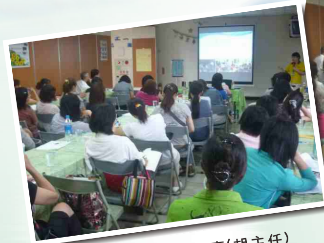
▲ 口腔保健機構經驗分享(胡主任)