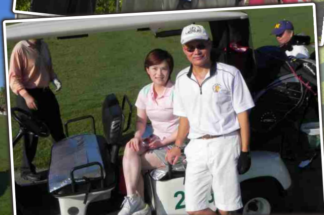
桃園縣牙醫師公會99年度理事長盃高爾夫球錦標賽