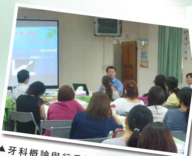
▲ 牙科概論與行為管理及潔牙技巧(簡醫師)