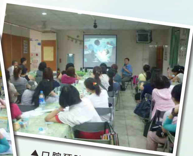
▲ 口腔預防保健基本常識(簡醫師)