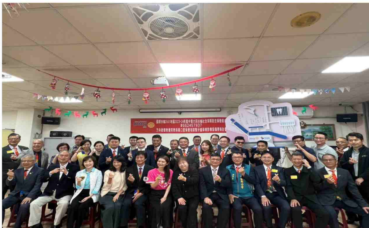
▲ 6/4 方舟啟智教養院牙科診療室設備更新揭牌儀式大合影 『取之於社會，用之於社會』