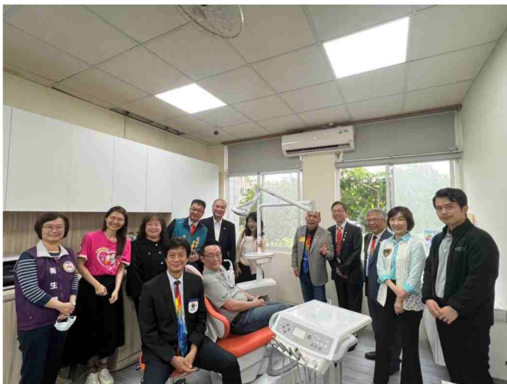
▲6/4 方舟啟智教養院牙科診療室設備更新與會貴賓合影