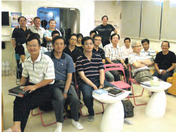
全方位讀書會小而溫馨的活動會場,以及與會醫師。