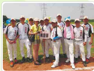
▲ 第五屆全國牙醫師慢壘賽