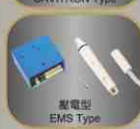
壓電型 EMS Type