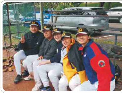
▲ 北區牙醫師慢壘賽