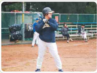
▲ 北區牙醫師慢壘賽