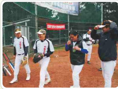
▲ 北區牙醫師慢壘賽 · 又濕又冷的天氣