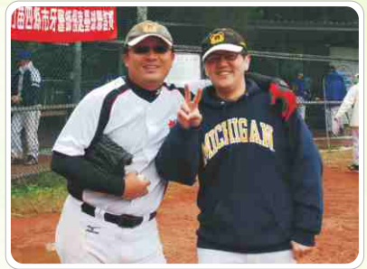
▲ 北區牙醫師慢壘賽