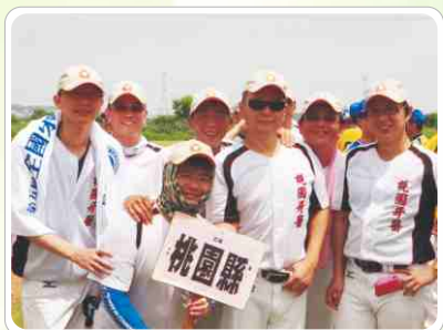
▲ 第五屆全國牙醫師慢壘賽

聽說，明年由我們主辦第六屆全國牙醫師慢壘賽，正確的講，應該是由北區四縣市合辦，桃園縣是主辦方之一。為了留住冠軍，所以，強烈希望年輕有活力的熱血，與我們一起打拼明年冠軍。