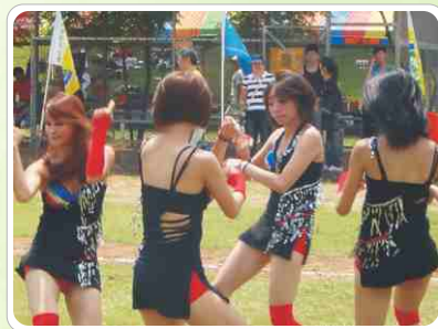
▲ 第五屆全國牙醫師慢壘賽 -新竹縣的啦啦隊