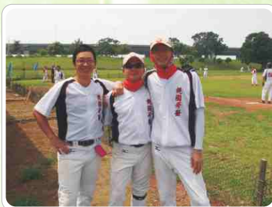
▲ 第五屆全國牙醫師慢壘賽