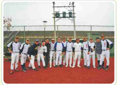
▲ 本隊在大溪球場練球