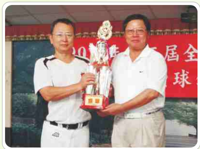
▲ 本隊獲得第五屆全國牙醫師慢壘賽亞軍