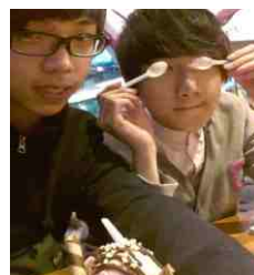
這兩隻竟然還吃冰淇淋 > <