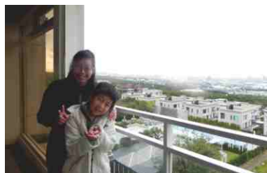
張秋月小姐與她的寶貝兒子